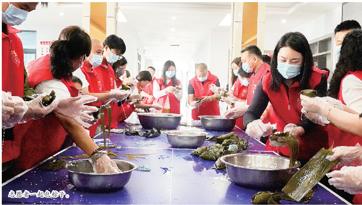
志愿者一起包粽子。